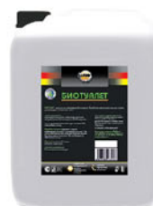
Упаковка (л): 5

Средство для резервуаров биотуалетов. Способствует растворению твердых отходов, дезинфицирует, нейтрализует запах.