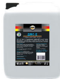
Упаковка (л): 20

Пенное щелочное моющее средство с дезинфицирующим эффектом на основе активного хлора для пищевой и перерабатывающей промышленности. Обладает отличными дезинфицирующими, обезжиривающими и очищающими свойствами. Имеет хорошие диспергирующие и антистатические свойства. Эффективно работает в воде любой жесткости. Благодаря устойчивой пене, средство проникает в любые труднодоступные места и обеспечивает отличное качество мойки.