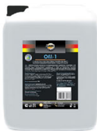
Упаковка (л): 20