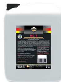
Упаковка (л): 20

Универсальное пенное щелочное моющее средство, предназначенное для удаления комплексных органических и неорганических загрязнений, в том числе застарелых (жиры, белки, копоть, бытовая и уличная грязь, смолистые загрязнения) с поверхностей из керамики, бетона, камня, пластика, нержавеющей стали, стекла, дерева, кроме окрашенных бытовыми красками, алюминия, хрома, резины. Легко смывается с очищаемых поверхностей. Используется для мытья полов, стен производственных помещений, всех видов оборудования, рабочих поверхностей, тары, ёмкостей, трубопроводов на предприятиях пищевой, молочной, мясоперерабатывающей, рыбоперерабатывающей, хлебопекарной, кондитерской промышленности, предприятиях по производству напитков и общественного питания.