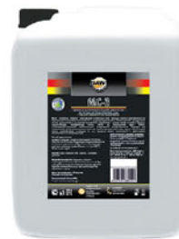
Упаковка (л): 20

Щелочное средство, образующее стабильную пену, которая хорошо удерживается на вертикальных поверхностях и проникает в труднодоступные места. Предназначено для удаления копоти, пригоревших и застарелых органических загрязнений с грилей, печей, коптилен, духовок, трубопроводов, керамической плитки, полов на предприятиях мясо-, птице-, рыбоперерабатывающей, хлебопекарной, кондитерской промышленности. Подходит для поверхностей, устойчивых к сильным щелочам (стали, нержавеющей стали, чугуна, керамической плитки, щелочестойких полимеров и т.д.). Средство можно использовать с применением пенокомплекта и пеногенератора.