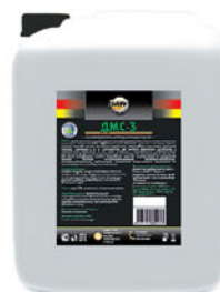
Упаковка (л): 20

Пенное щелочное моющее средство с дезинфицирующим эффектом на основе четвертичных аммониевых соединений (ЧАС). Эффективно против бактерий, дрожжей и плесневых грибов, штаммов кишечной палочки, золотистого стафилококка, пневмококка, фекальных бактерий, сальмонелл и т. д. Предназначено для удаления комплексных органических и неорганических загрязнений, в том числе застарелых с одновременной профилактической дезинфекцией. Средство можно использовать для мытья полов, стен производственных помещений, всех видов оборудования, рабочих поверхностей, емкостей, трубопроводов на предприятиях пищевой, молочной, мясopерерабатывающей, рыбopерерабатывающей, птицеперерабатывающей, хлебопекарной, кондитерской промышленности, предприятиях по производству напитков и общественного питания.