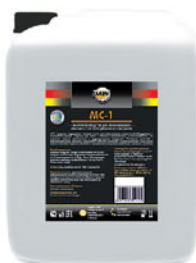
Упаковка (л): 20