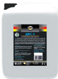
Упаковка (л): 20