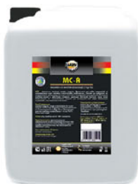
Упаковка (л): 20