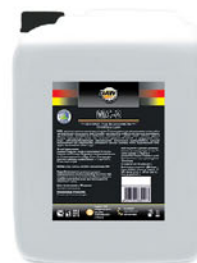
Упаковка (л): 20

Щелочное низкопенное моющее средство. Рекомендовано для автоматических систем мойки, где недопустимо образование пены. Подходит для обработки поверхностей методом замачивания. Удаляет копоть, пригоревшие и застарелые загрязнения с грилей, печей, коптилен, духовых шкафов, трубопроводов, полов, стен, покрытых керамической плиткой, на предприятиях мясо-, птице-, рыбоперерабатывающей, хлебопекарной, кондитерской промышленности. Средство предназначено для поверхностей, устойчивых к сильным щелочам (стали, нержавеющей стали, чугуна, керамической плитки и т.д.)