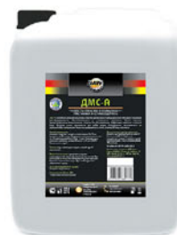
Упаковка (л): 20

Щелочное дезинфицирующее средство для пищевой промышленности. Обладает отличными дезинфицирующими, обезжиривающими и очищающими свойствами. Имеет хорошие диспергирующие и антистатические свойства. Не образует пены. Эффективно работает в жесткой воде. Средство может применяться для любых видов оборудования, изготовленного из щелочестойких материалов, таких как нержавеющая сталь, различные виды пластиков.