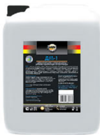
Упаковка (л): 20