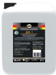
Упаковка (л): 20