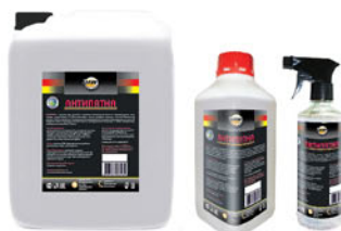
Упаковка (л): 0,5; 1; 5

Средство для удаления с различных поверхностей пятен от нефтепродуктов, смол, битума, следов резины, а также пятен жира, чернил, граффити, маркера, остатков жевательной резинки. Легко справляется с техническими загрязнениями и остатками консервирующих составов. Не нарушает цвет и структуру лакокрасочного и хромированного покрытия, а также поверхностей, выполненных из пластика и стекла.