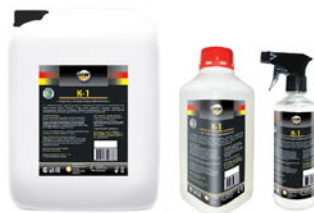
Упаковка (л): 0,5; 1; 5

Профессиональное средство для ухода за изделиями из натуральной и искусственной кожи любых оттенков. Глубоко проникает в поры, хорошо увлажняет и защищает поверхность от растрескивания. Благодаря композиции силиконов восстанавливает структуру кожи. Придает кожаной обивке ухоженный вид и эластичность. Не содержит растворителей.